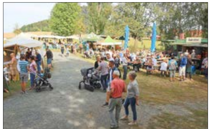
Bergwiesenfest in Königstein-Ebenheit

Tel. 03504 629660, info@lpv-osterzgebirge.de, www.lpv-osterzgebirge.de