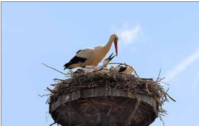
Wer bringt eigentlich die Kinder des Klapperstorches? Weißstorch mit Jungvögeln im Horst – Beispielfoto.

Die Naturschutzstation Osterzgebirge unterstützt mit dem Monitoring die Arbeit der Unteren Naturschutzbehörde des Landkreises.